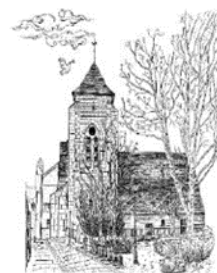
Paroisse Sainte Colombe