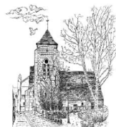
Paroisse sainte Colombe