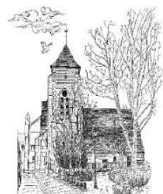
Eglise Sainte Colombe

Fermée à partir du 21 octobre reprise le 1 er décembre