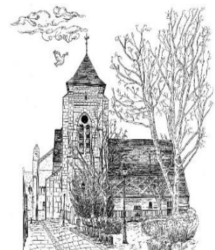
Paroisse Sainte Colombe

3 rue Jaume Mardi 16h-18h30 Vendredi 16h-18h30 Samedi 10h-12h