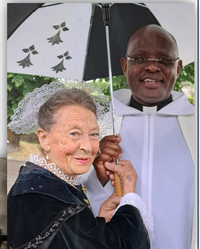
Des rencontres sympathiques