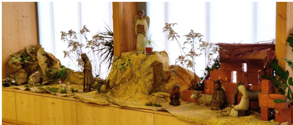
Crèche Notre Dame de La Trinité