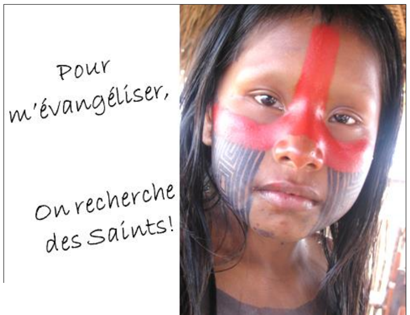
Jeune fille Kayapos

Extraits d'une interview d'un évêque d'Amazonie