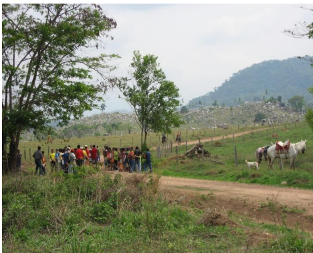
Paysage d'Amazonie déforesté pour l'élevage (Brésil)

Alors, oui, notre Synode offrira des réponses dont le monde entier, la France et l'Amazonie ont besoin pour avancer vers un monde plus humain, plus fraternel et plus fils de Dieu : où la personne est reconnue dans sa dignité de fille de Dieu.