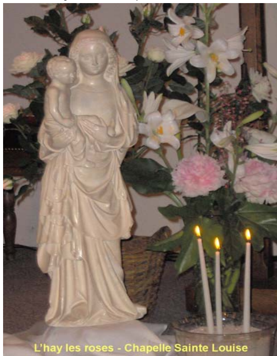
L'Hay les roses - Chapelle Sainte Louise