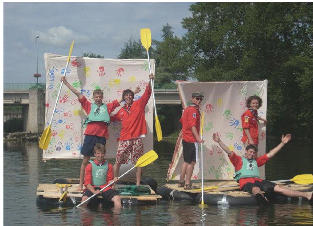
Des souvenirs inoubliables !

Nous avons passé deux nuits sur les bords de l'Ain.