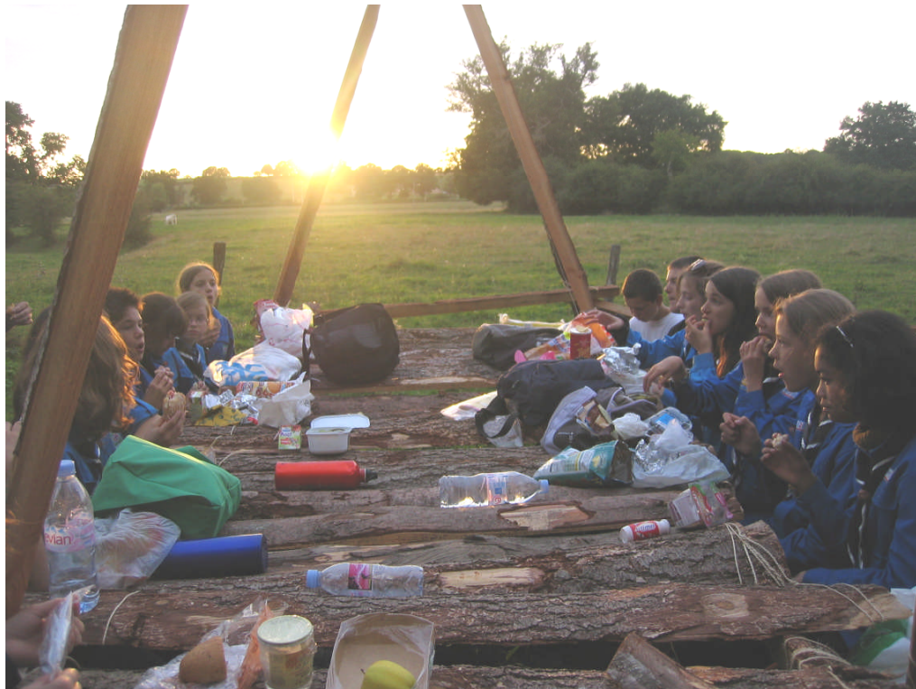
Camp du 4 au 15 Août 2009 en AUVERGNE à Vaumas

Cet été, nous les Scouts et Guides de France de l'Hay-Les-Roses, sommes allés à Vaumas en Auvergne. Durant les deux premiers jours, nous avons installé le nécessaire pour vivre pleinement notre camp (tables, douches, feuillets etc...). Lors de notre exploration de troupes, nous avons pu dormir à la belle étoile.