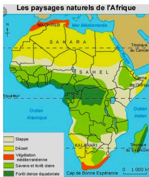
Les zones de désert sont situées de part et d'autre de l'équateur (où se trouve la RDC), au niveau des 2 tropiques

Cette double pression en provenance du Nord et du Sud, donne l'impression que l'Afrique Centrale se retrouve dans un étau. D'où la nécessité de trouver une solution concertée. C'est pourquoi la région SADEC à laquelle appartient la RDC doit, de concert avec les autres nations impliquées, réfléchir aux solutions appropriées. Les différents blocs régionaux gagneraient à mener des discussions régionales et continentales pour élaborer des