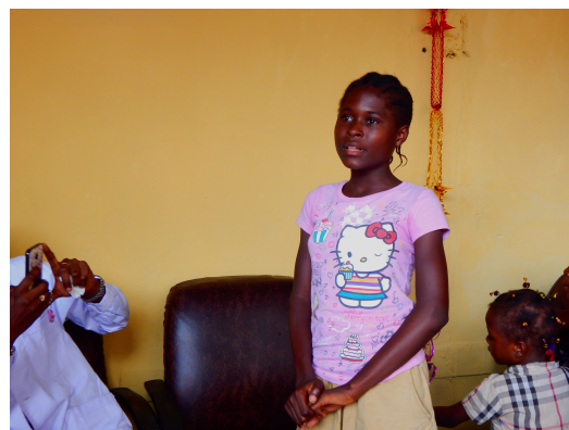
Témoignage d'une fille de 12 ans infectée, traitée et guérie du virus. (activité financée par Médecins sans frontières)

Spécialement les mamans Simameni ont été formées sur les connaissances élémentaires en rapport avec l'épidémie. La bonne nouvelle est