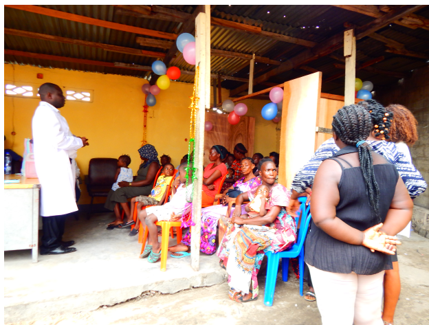
Explications sur la maladie, son mode de transmission...

Mission : Une équipe Simameni composée d'environ 40 volontaires sélectionnés par l'équipe médicale est allée sur terrain à Béni, Goma et ses environs, pour se joindre à la riposte dans son volet sensibilisation.