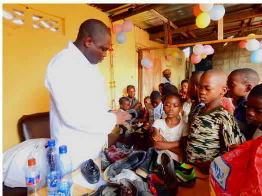
Distribution de moyens de prévention, dont des chaussures, aux enfants

lait maternel...) éventuellement à même le sol, d'où l'importance des chaussures cf photo ci-dessous]