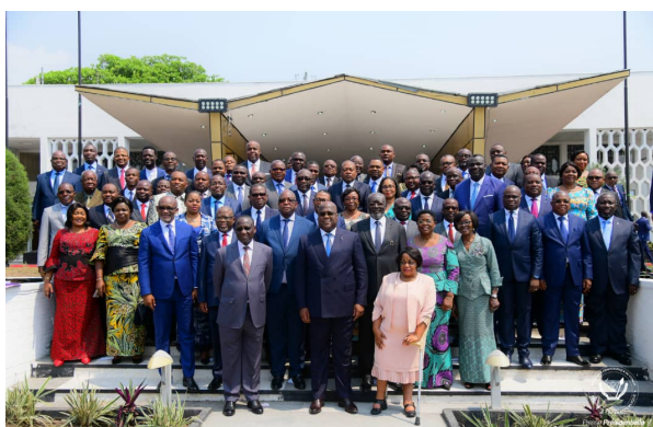
L'équipe gouvernementale autour du président Félix-Antoine

avait enfin un gouvernement éléphantinesque de 65 Portefeuilles. Dans cette équipe, 17% sont des femmes dont une à mobilité réduite ; 76,9% des ministres et vice-ministres n'ont jamais pris part à un gouvernement. Cette équipe a la lourde mission de faire souffler un vent nouveau sur un pays qui redoutait de fortes violences pré ou post-électorales.