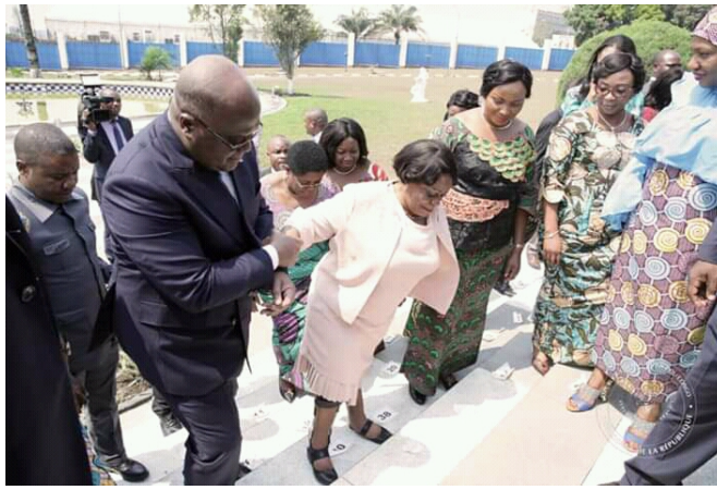
Le président Félix-Antoine Tshisekedi accompagnant la Ministre à mobilité