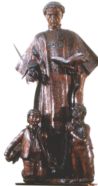
Saint Léonard revêtu de la dalmatique. A ses pieds, deux prisonniers qui implorant leur délivrance.

Autrefois, il était de tradition, dans les paroisses, de célébrer avec faste et solennité la fête du saint patron. A L'Haÿ-les-Roses, l'habitude ne s'est guère perpétuée. Qui sait encore que le 6 novembre est jour de la saint Léonard, patron de notre paroisse ?