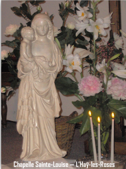
Chapelle Sainte-Louise — L'Haÿ-les-Roses

Comme Jésus-Christ, dans sa lumière, elle apparaît à la fois comme signe de contradiction et comme signe de paix. Les quatre Évangiles et le Nouveau Testament en disent peu sur elle, certaines pratiques se focalisent beaucoup sur elle mais questionnent, des éléments de nos cultures contemporaines ne rendent pas facile l'attachement à elle. Et pourtant les Écritures bibliques la donnent comme présente aux moments clés de l'histoire du Christ, et